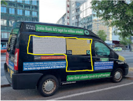
Første Jyske Bank bil skal have nye reklamer..jpg 559K