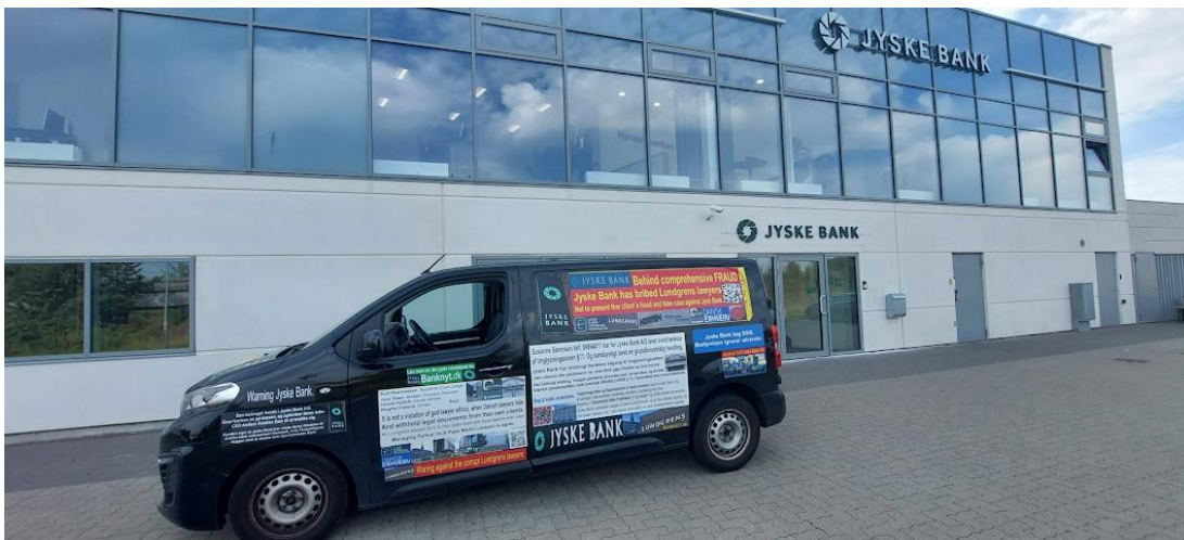
Jyske bank bilen besøger Jyske bank Egedal

Tilknyttet som bestyrelsesmedlem Fra 10.06.1971 til 26.10.1987