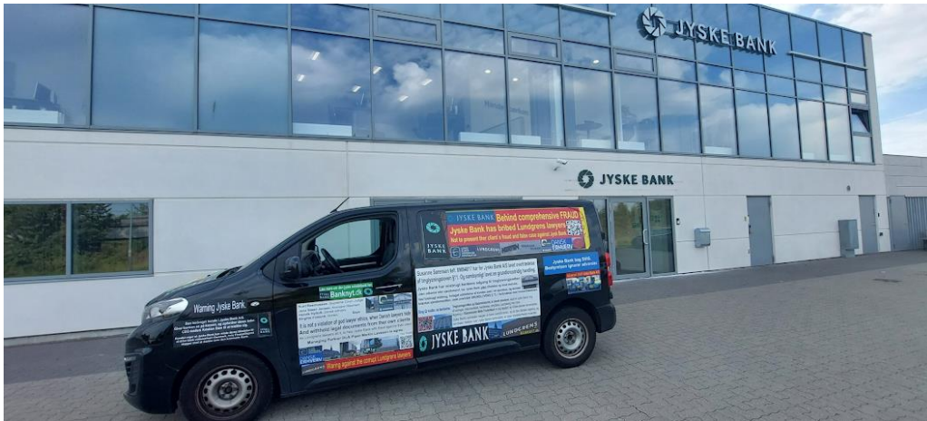
Jyske bank bilen besøger Jyske bank Egedal

Tilknyttet som bestyrelsesmedlem Fra 24.09.2001 til 11.06.2002